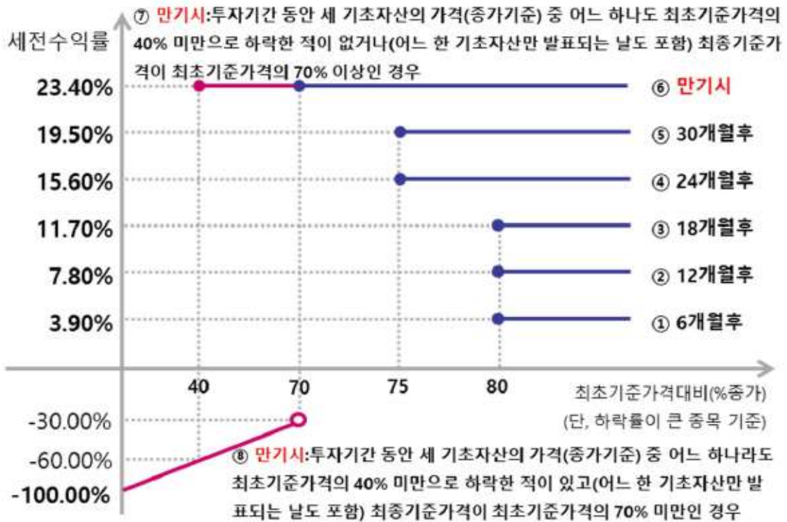
제3130회 파생결합증권 (예상 손익구조 그래프)